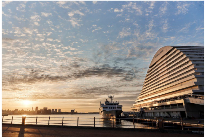
神戸メリケンパークオリエンタルホテル