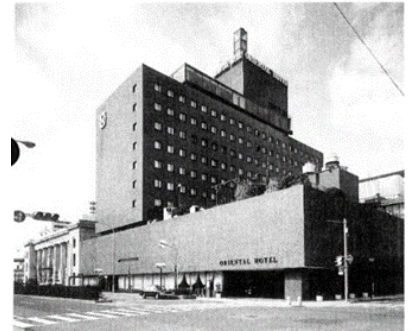
▲旧オリエンタルホテル

オリエンタルホテルは何度も移転を繰り返し、1964年（昭和39年）には京町25番地へ移転。その際、第5代社長に就任していた日本郵船の安部正夫氏が、“港街・神戸のシンボルに”という想いのもと、日本で初めてホテルの敷地内に建つ公式灯台が設置されました。1995年（平成7年）1月17日に阪神淡路大震災が発生し、ホテルは全壊、営業停止となりました。