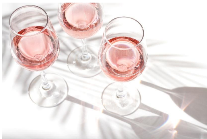
テラス席イメージ

本企画では、ALL FLAGS のブッフェ料理に加え、ロゼスパークリングワイン付きのフリーフローをお楽しみいただけます。お席のご利用時間は通常より 30 分長い 120 分制のため、ゆったりとしたひとときをお過ごしいただけます。ドリンクには、桜を彷彿とさせる淡いピンク色が印象的なロゼスパークリングワインを、本プラン限定でご用意しました。柔らかな陽光に透ける繊細なロゼの色合いと、グラスの底から立ち上るきめ細かな泡が、まるで春風に舞う桜の花びらのように、テーブルを彩ります。