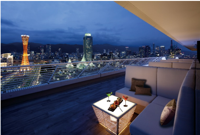
<「ROOF TOP AIR」のイメージ>

神戸メリケンパークオリエンタルホテル（所在地：兵庫県神戸市中央区／総支配人：荒木潤一）では2018年4月1日（日）より、最上階のバー「VIEW BAR」のテラス席を今年もオープンします。神戸ポートタワーを目の前に神戸の絶景がパノラマで広がる人気のテラスを確約するプラン『ROOF TOP AIR』は、圧巻の景色を特等席で眺めながら春を感じるフルーツカクテルと3種のスナック盛り合わせで春の夜を堪能していただけます。