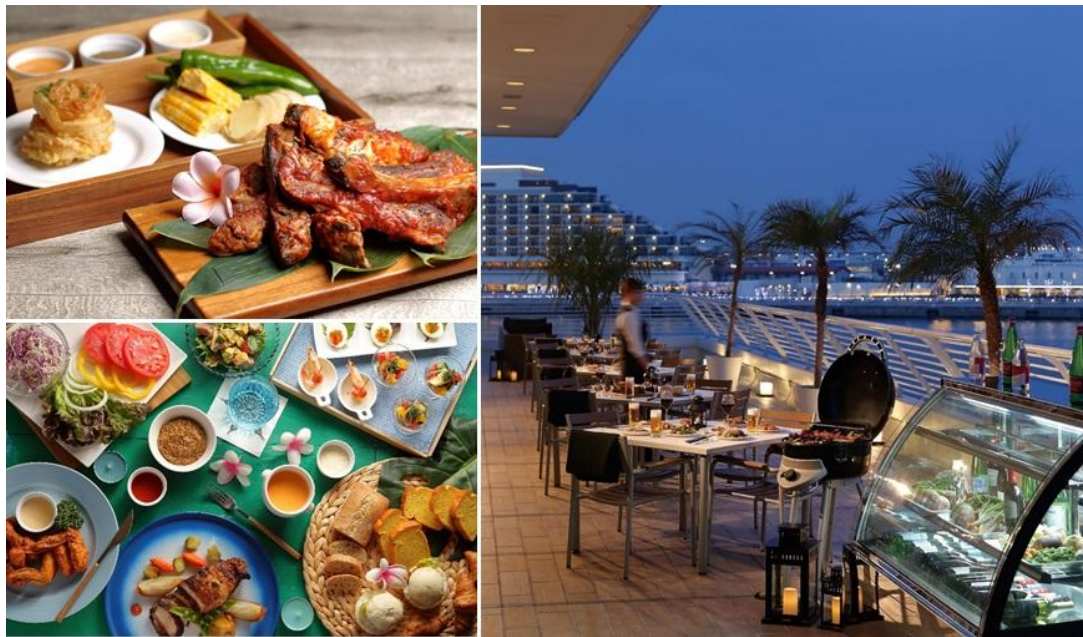
<左上：ビアテラス限定メニューのイメージ、左下：バイキング料理イメージ、右：ビアテラスのイメージ>

目の前でシェフが仕上げるライブキッチンの料理や、ホテルの和洋中の各料理長が考案したメニューをバイキング形式でお楽しみいただけるほか、生ビールやカクテル、ソフトドリンクなどのフリードリンクがセットになったプランを提供いたします。また、ビアテラス限定メニュー（別途料金要）としてスペアリブ、3種の野菜、オニオンリングがセットになったプランもご用意いたします。